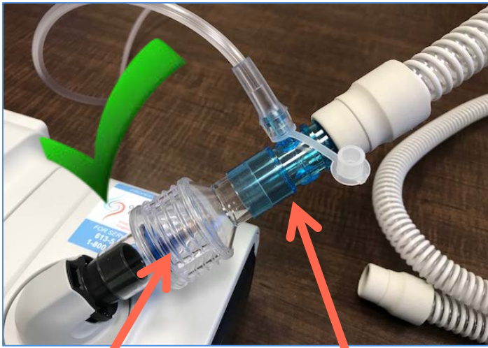
Valve de pression Numéro de référence Respironics 302418